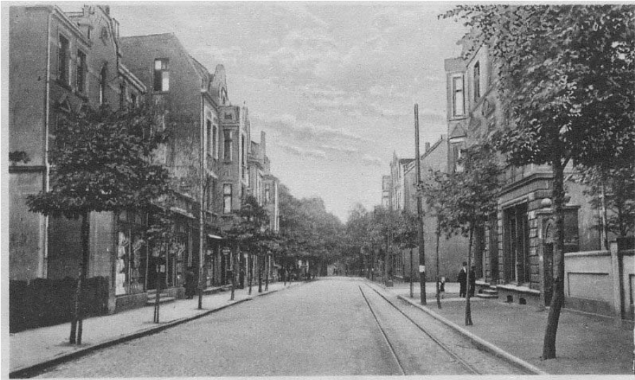
Werne (Kreis Bochum) Freiheitsstraße

Wirtschaft Schmitz rechts und Woll-, Weiß- und Kurzwaren Rübke links. Poststempel 5.7.1943.